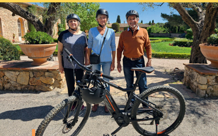
Visites et dégustations des deux domaines Arcois à tarif préférentiel