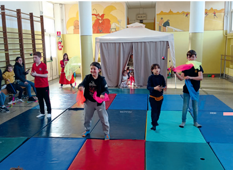
Après l'étude des arts du cirque, les maternelles et élémentaires ont donné une représentation