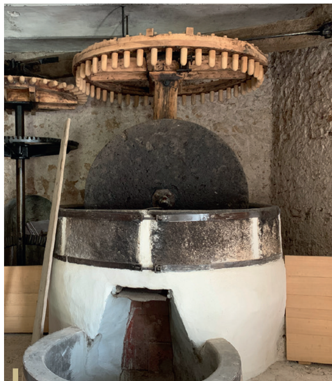
Le broyage des olives au Moulin de Sainte Cécile

* Ces investissements sont subventionnés, cf. partie «Les Financeurs».