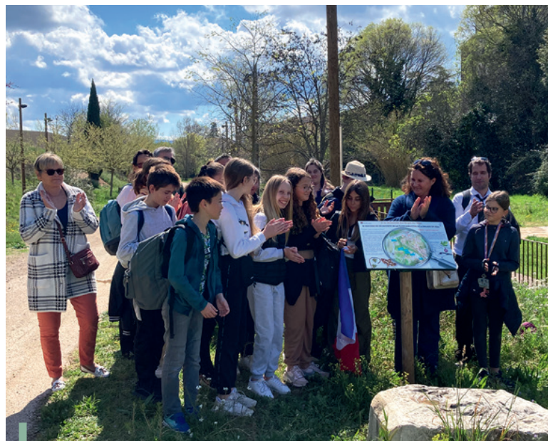
Inauguration du sentier « À la découverte des berges du Réal ».

Mme le Maire, accompagnée d'élus, a eu le plaisir de recevoir les élèves du collège et leurs enseignants pour les féliciter de ce travail professionnel, riche et rondement mené.