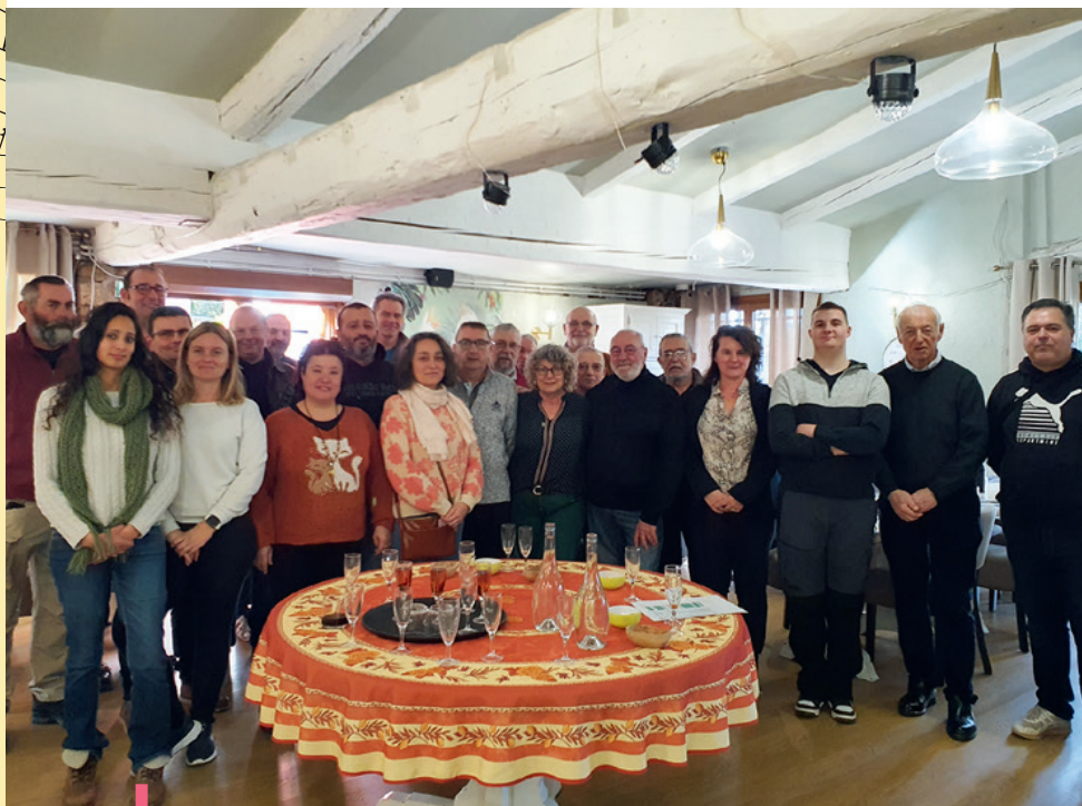
Les membres du Comité Communal des Feux de Forêts.

De même, le contrôle du stationnement en zone bleue se fera de façon plus assidue afin de garantir un roulement régulier pour l'accès aux commerces et services. Pour rappel, le stationnement en zone bleue est autorisé et gratuit pendant 1h30 avec l'utilisation d'un « disque bleu ». Ce dernier est à retirer gratuitement à l'accueil de la mairie et de la police municipale.