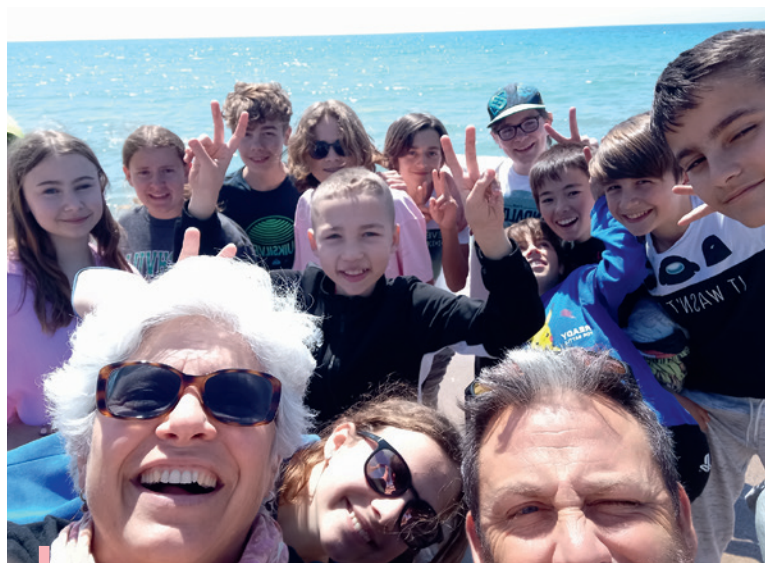
Sortie à la base nature de Fréjus