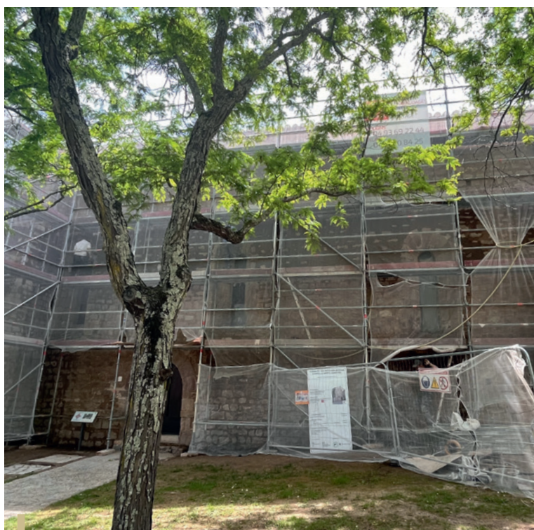
Rejointoyage de la chapelle Sainte-Roseline.