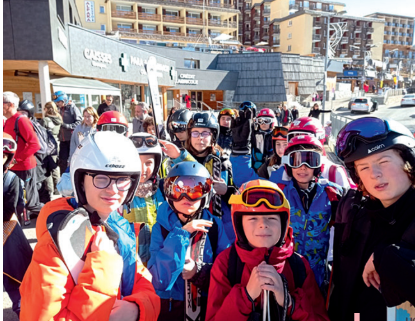
Séjour de sport d'hiver à Saint-Michel-de-Chaillol