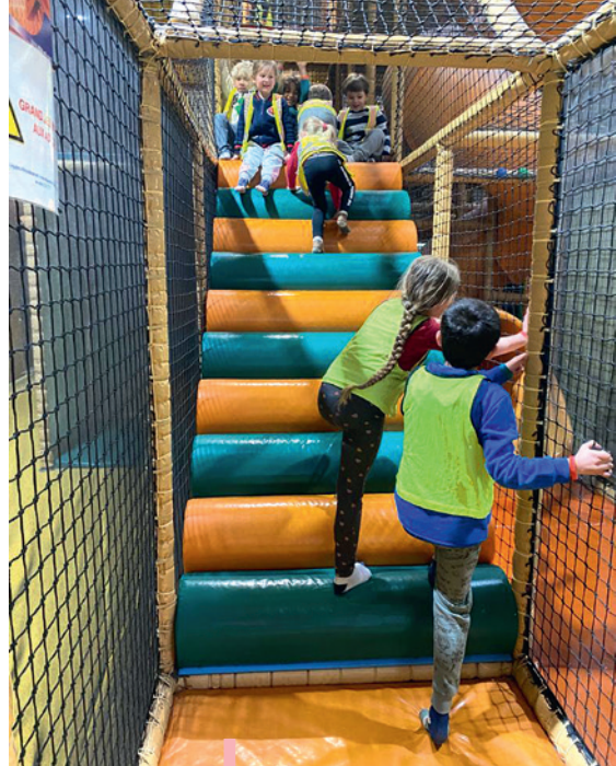
Sortie à "Funcity"