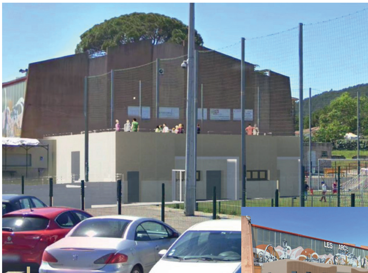
Insertion paysagère des vestiaires de la salle polyvalente

* Ces investissements sont subventionnés, cf. partie « Les Financeurs ».