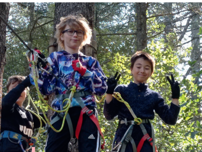
Journée à Aoubré