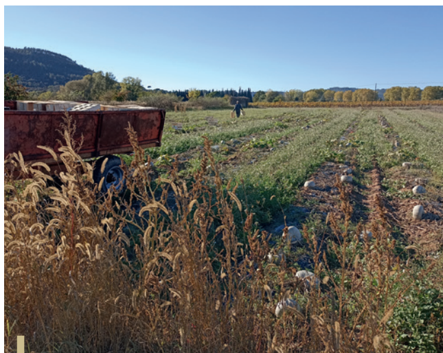
La ferme maraîchère communale approvisionnera les écoles dès 2024

La mairie recrute pour la rentrée de septembre 2023 un agriculteur qui aura en charge l'exploitation du terrain. Pour la réalisation des 500 repas quotidien délivrés par la