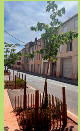
95 arbres fruitiers et ornements ont été plantés au printemps.