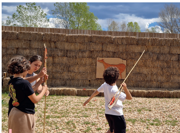
Visite du musée de la préhistoire de Quinson