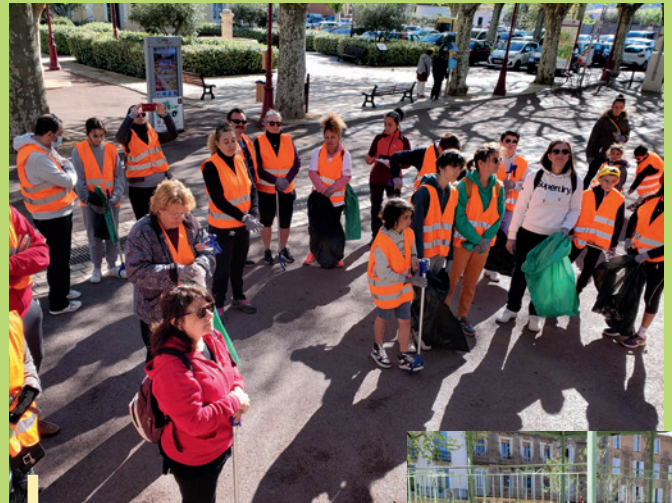
Une quarantaine de participants et 68,3kg de déchets ramassés pour l'opération « Nettoyons le Sud »

Rappelons que le service d'entretien de la ville n'est pas missionné pour ramasser les déchets des citoyens manquant totalement de civisme mais pour maintenir la propreté et la salubrité des espaces publics.