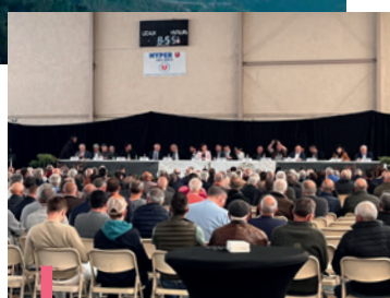
Assemblée des chasseurs le 24 avril 2023

« Savez-vous vraiment ce qu'est la chasse ? » Une vidéo à découvrir sur chasseurdefrance.com