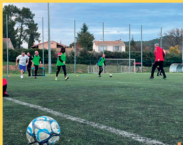
Le « Foot en marchant », une activité proposée chaque semaine aux membres du Pôle Séniors

Toutes nos félicitations à l'Entente Bouliste Arcoise qui a gagné le championnat du Var promotion en triplé et concourra pour le championnat de France en juillet !