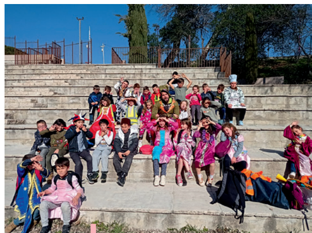
Carnaval de L'A.L.S.H.

*Pots en terre cuite enfoncés pour moitié dans la terre, permettant de conserver l'humidité du sol.