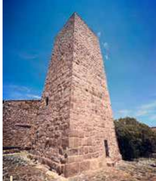
Tour du Parage restaurée

La tour du château des Arcs, datant de 1250, domine le territoire. Remaniée à plusieurs reprises au fil des siècles avec des ouvertures percées et rebouchées, elle présentait des signes de détérioration tels que des joints disparus, des fissures, et la croissance de mousse. La réhabilitation a donc inclus le déjointoiement, le rejointoiement des façades, la consolidation des pierres endommagées et l'application d'un produit hydrofuge