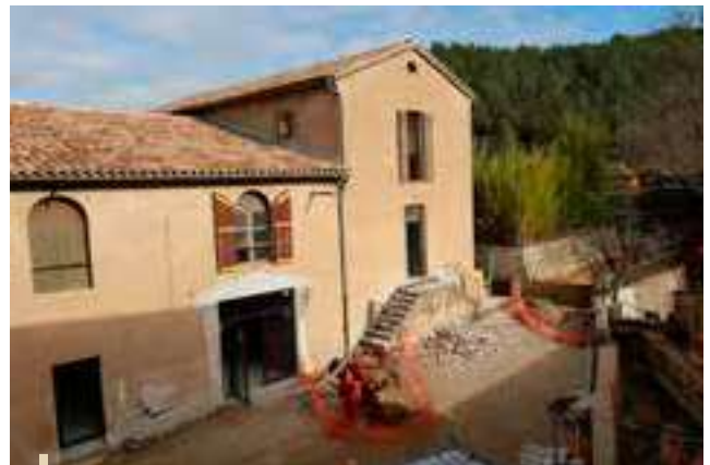
Sainte-Cécile : restauration en cours

Nous tenons à remercier chaleureusement les associations Les Médiévales et le CASC qui ont participé à la réalisation du musée ainsi que toutes les personnes qui ont fait dons d'objets.