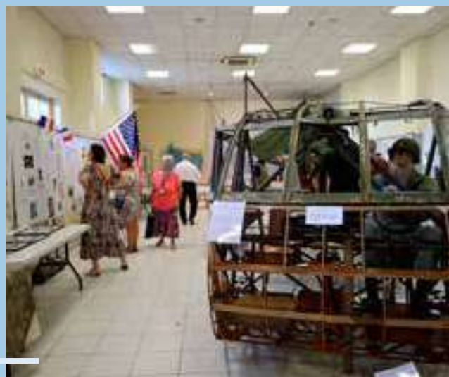
Exposition "Fête de la Libération des Arcs"