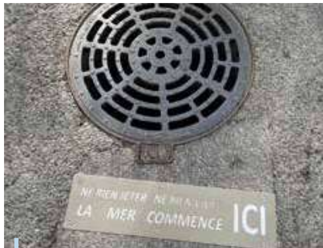
Ne rien jeter, ne rien vider, la mer commence ici

Adoptée en 2021, elle s'intègre dans le label « Une Cop d'Avance » de la Région Sud. Cette charte a engagé la commune dans la mise en œuvre d'actions pour la diminution des déchets plastiques dans les milieux naturels et en stockage. Une part importante correspond à la sensibilisation du public (organisation de manifestations, publication d'articles, pose de plaques « ici commence la mer » au niveau du pluvial, etc.).