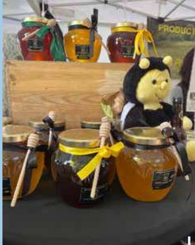
Fête du Miel