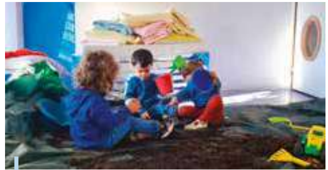
Atelier découverte à la crèche

Par ailleurs, la crèche Le Greou s'ouvre également sur la communauté locale. Des moments intergénérationnels, tels que les rencontres avec les membres