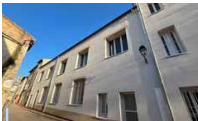
Isolation de l'Hôtel de Ville par l'intérieur et l'extérieur