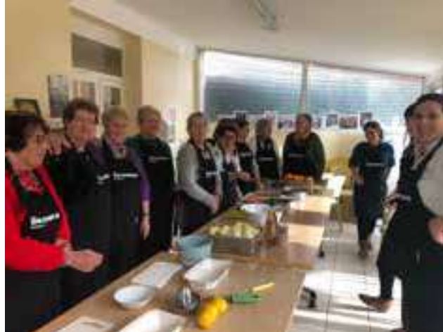
Atelier culinaire au Cepoun