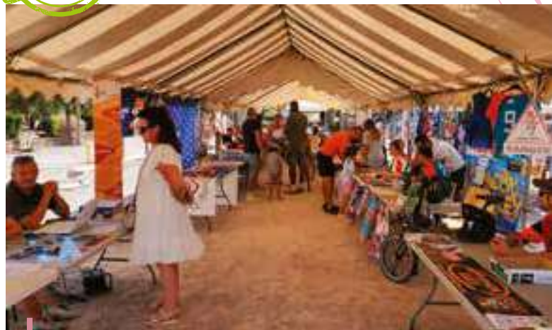
Journée des associations

Tout comme les associations ne pourraient fonctionner sans le bénévolat. S'il fallait qu'elles rémunèrent le travail des nombreux bénévoles, là encore elles ne pourraient boucler leur budget. L'occasion nous est donnée de souligner l'importance de ce bénévolat, de remercier l'ensemble des bénévoles des associations et de rappeler que pour leur investissement, ils prennent du temps sur leur vie personnelle et parfois professionnelle.