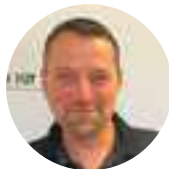
Léo Domergue Animations