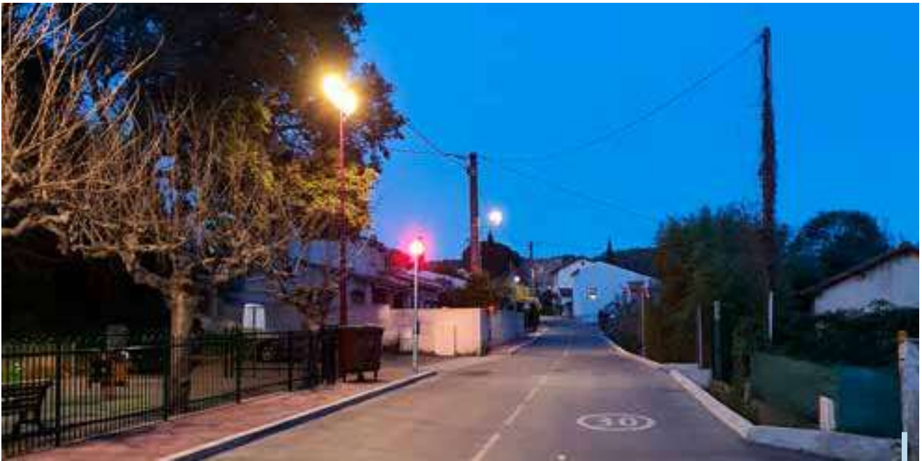
Nouvel éclairage public boulevard des Moulins

Dans les deux cas, l'idée est ici de laisser plus de place aux surfaces désimperméabilisées ainsi qu'à la végétation permettant ainsi d'améliorer le cadre de vie pour les habitants tout en accordant une attention particulière aux nouveaux modes de déplacement et au maintien du stock de places de stationnement disponible.