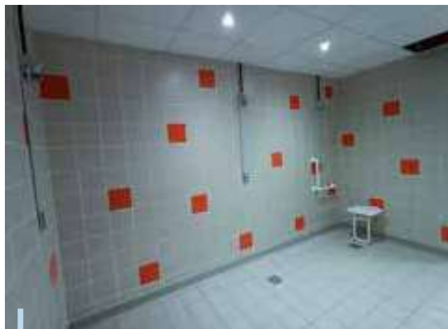
Nouveaux vestiaires de la salle polyvalente