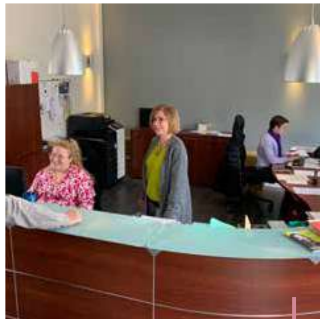
Agents d'accueil de l'Hôtel de Ville

Si en fin de journée celle-ci ne l'est plus, eux n'y sont pour rien... Même si chacune de nos actions peut être améliorer.