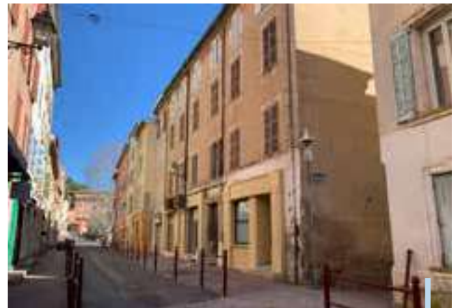
Immeuble acquis par la commune pour une rénovation totale

La SAIEM intervient en tant que partenaire de notre commune afin de l'accompagner dans des opérations de rénovation d'immeubles dont elle est propriétaire ou non. C'est ainsi que la SAIEM est en cours de réhabilitation de trois immeubles (2 immeubles publics situés rue de la Motte et 1 immeuble privé situé rue Pasteur) qui donneront lieu à la création de 5 logements. Les travaux de sécurisation, de désamiantage et de démolition ont déjà eu lieu. En 2024, les travaux restants devraient être finalisés.