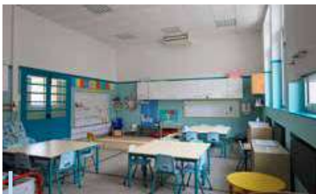
Isolation de l'intégralité du bâtiment, changement des rideaux et équipement de climatisation.