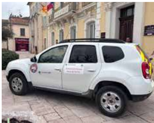
Véhicule du CCFF financé par la commune

La sauvegarde de la forêt communale passe aussi par le débroussaillage. Cette obligation légale nous concerne tous. La commune a signé une convention d'éco-pâturage pour l'entretien des abords des pistes DFCI. Ainsi, à la bonne période, vous pourrez apercevoir des chèvres qui réalisent l'entretien pour un débroussaillage naturel à fort impact écologique.