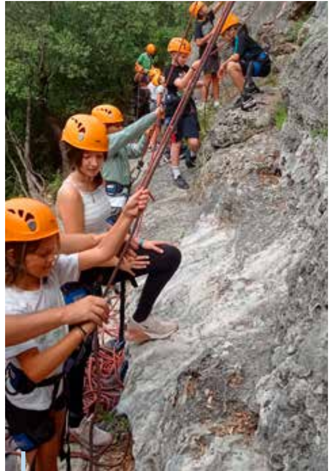
Sortie escalade avec le Club Ados

Par ailleurs, notre action éducative ne se limite pas aux heures de classe. Les équipes de l'ALSH concoctent des activités au service des enfants et de leur épanouissement autour de thématiques variées favorisant la découverte et l'apprentissage. Ces animations sont formalisées dans un « projet pédagogique » qui est revu pour chaque période. Le programme élaboré ne propose pas seulement des jeux. Il s'intègre dans les sujets actuels et fondamentaux de la vie citoyenne : sensibilisation au handicap, pratique sportive, éveil à la nature... L'ALSH est d'ailleurs labellisé Centre A'Ere depuis 2021 grâce à la mise en place d'actions en faveur de l'environnement.