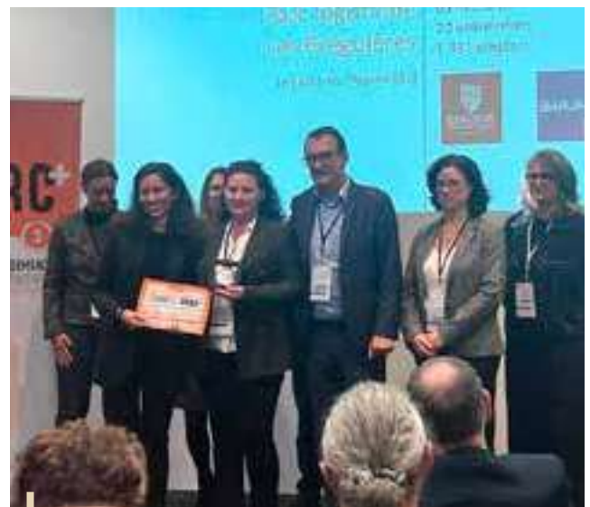
Remise de prix à Marseille pour le parc logistique des Bréguières

La construction en cours générera de nouveaux emplois.