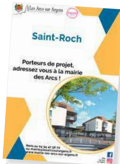
Une partie du quartier Saint-Roch sera dévolue à du commerce, ou des professions libérales

Pour chaque projet de construction, la municipalité s'est toujours attelée à garantir la mixité sociale à l'échelle de