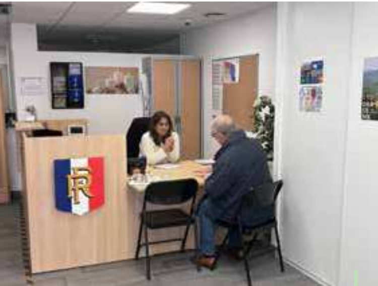
L'accueil de la Police Municipale