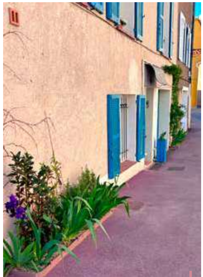
Végétalisation d'un pied de mur par le biais de "l'Opération de végétalisation"

L'embellissement des façades est un enjeu majeur pour la revitalisation du centre-ville. Retrouvez toutes les informations nécessaires sur le site de la ville, rubrique « le quotidien / aides financières ».