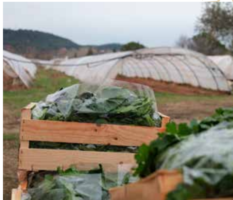
Première récolte de légumes verts