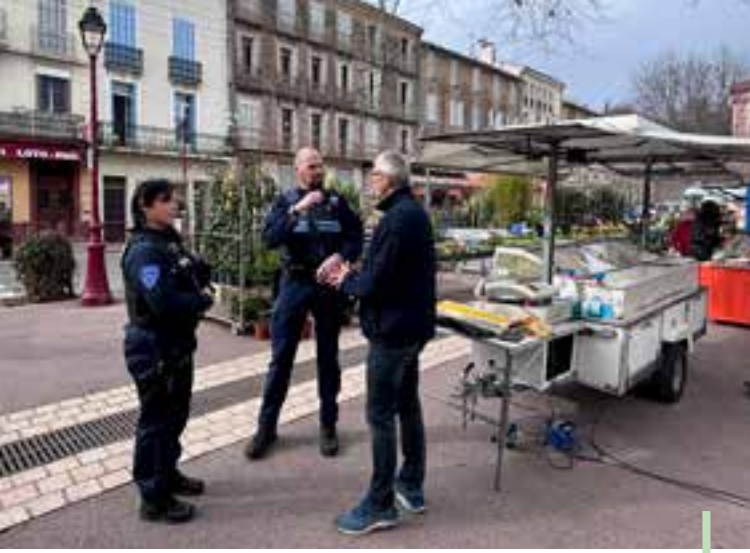
Les agents de la police municipale à l'écoute des citoyens