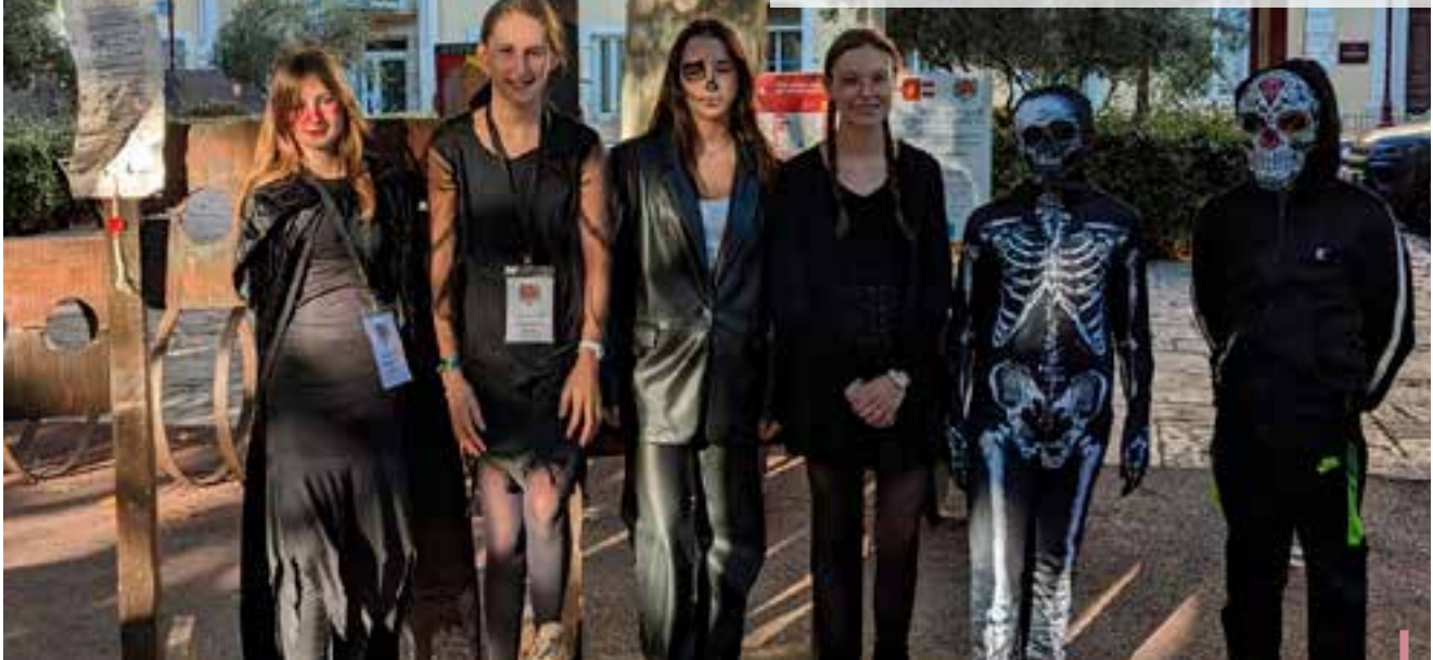
Organisation de la Fête d'Halloween par les conseillers Municipaux jeunes