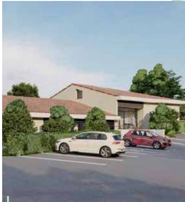
Insertion paysagère de la future maison médicale

Membre du groupe santé à la DPVa, Madame le Maire participe à la création d'un centre médical prochainement ouvert sur Vidauban. Bargemon, Sillans la Cascade et Comps bénéficieront d'une antenne. Notre local communal est quant à lui proposé pour une antenne potentielle et/ou l'accueil de nouveaux médecins, directement par la commune.