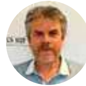
Philippe Cotte Événementiel