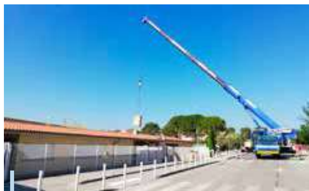
Installation de climatisation