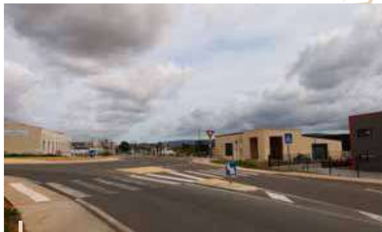
Zone d'activité économique de l'Écluse

Cette zone d'activité a permis la création d'un rond-point sur la RD10 permettant à la fois la desserte de part et d'autre de la zone d'activité, mais également d'améliorer la sécurité sur cette voie départementale.