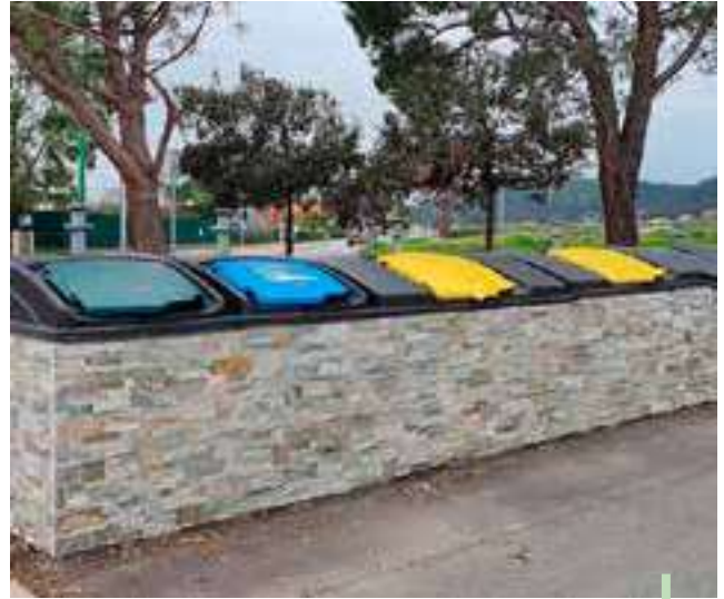
Nouveau PAV – Domaine des Oliviers

Pour rappel, la commune propose toujours la collecte de vos encombrants si vous n'avez pas la possibilité de les acheminer en déchèterie. Pour cela, prenez rendez-vous avec nos services au 04 94 99 52 15.