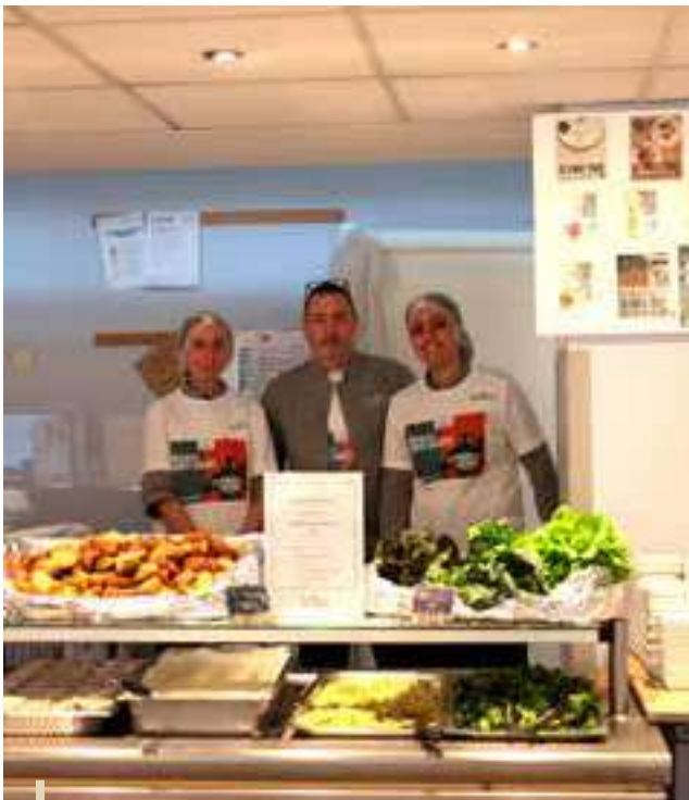
Transformation des produits de la ferme par la cuisine centrale