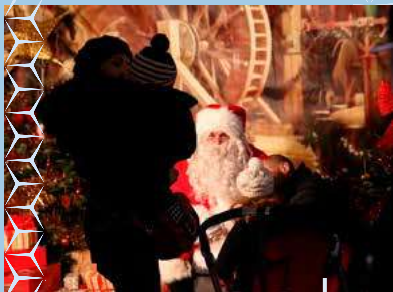
Noël au village