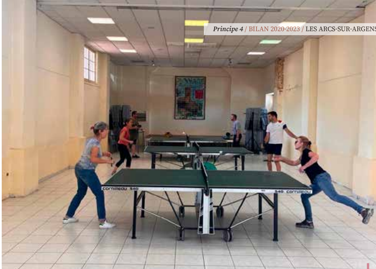
Cession sportive de la pause méridienne