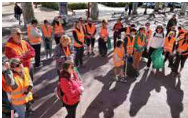
Journée de nettoyage organisée en partenariat avec la Région Sud "Nettoyons le Sud"

Dès qu'elle le peut, la commune participe aux journées et ateliers environnementaux organisés par ses partenaires. Une sensibilisation et une transmission d'information accrue posant un socle pour des futures actions entreprises par les citoyens.