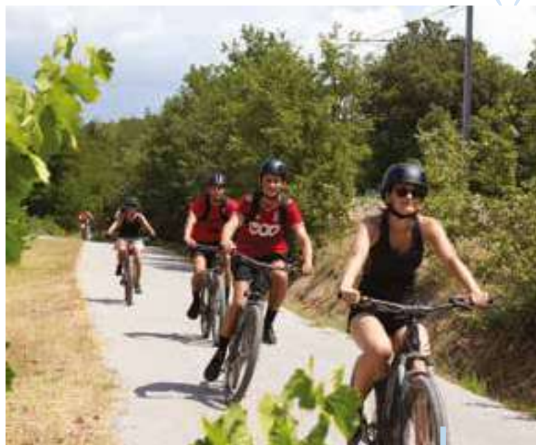
Visite des domaines viticoles à vélo