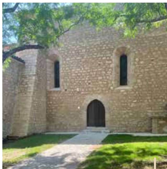
Chapelle Sainte-Roseline avant / après