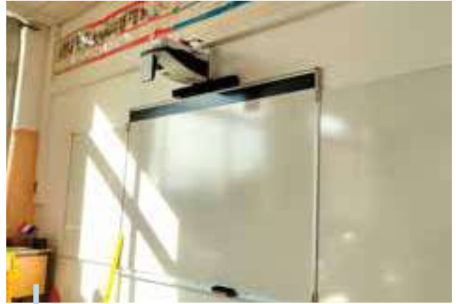
Tableaux blancs et système de vidéoprojection aux écoles à la rentrée

Parmi les acquisitions réalisées, nous comptons des vidéoprojecteurs et des tableaux blancs pour des projections qui peuvent évoluer vers de la VPI (vidéoprojection interactive), des systèmes de sonorisation en accompagnement, des tablettes pour la mise en place d'ateliers numériques en classes mobiles, et des ordinateurs pour renouveler l'équipement des enseignants. Une nouvelle plateforme collaborative (ENT) avec de nouvelles fonctionnalités a également été mise en place pour faciliter les échanges parents-enseignants.