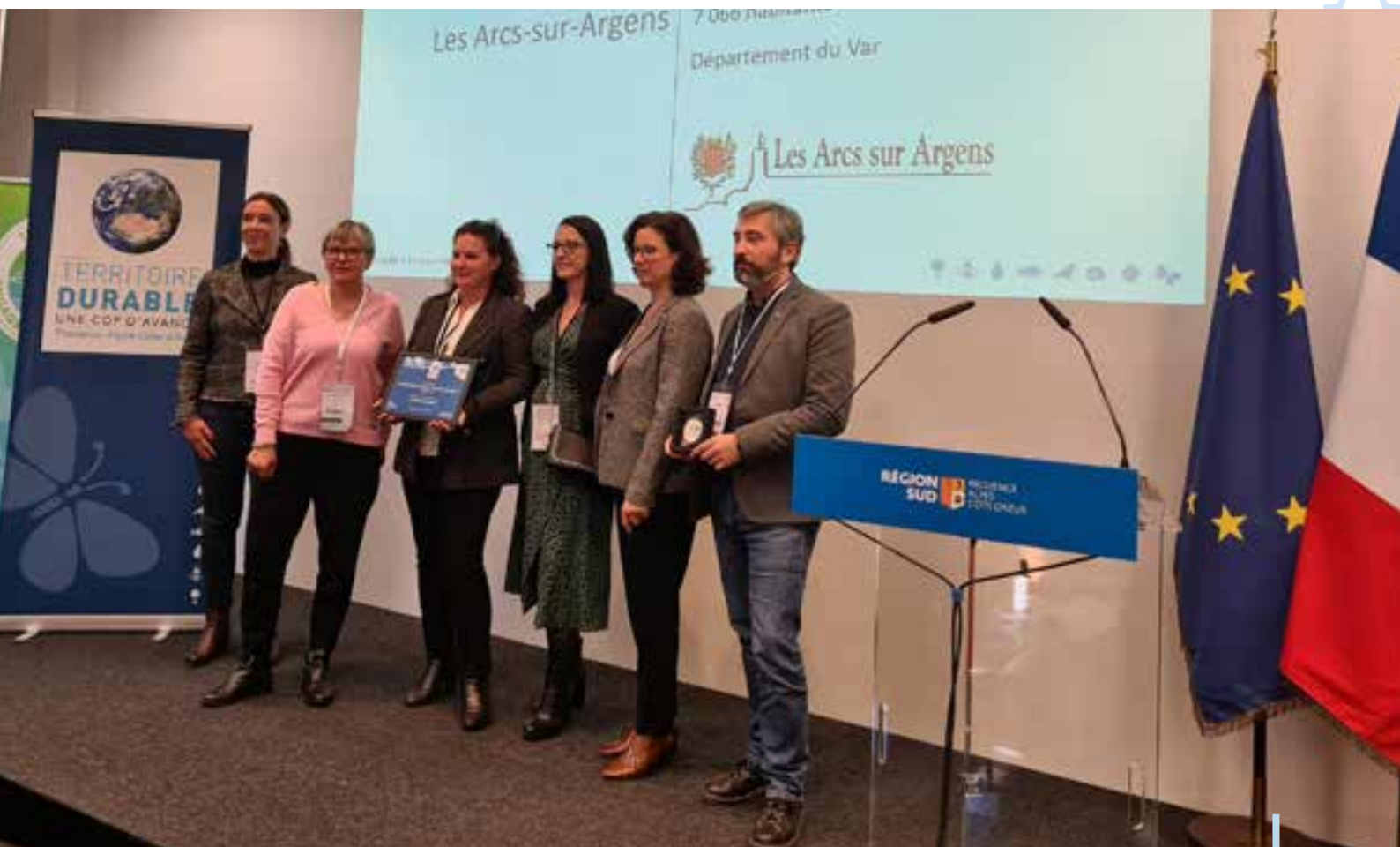
Remise de prix une Cop d'avance à Marseille