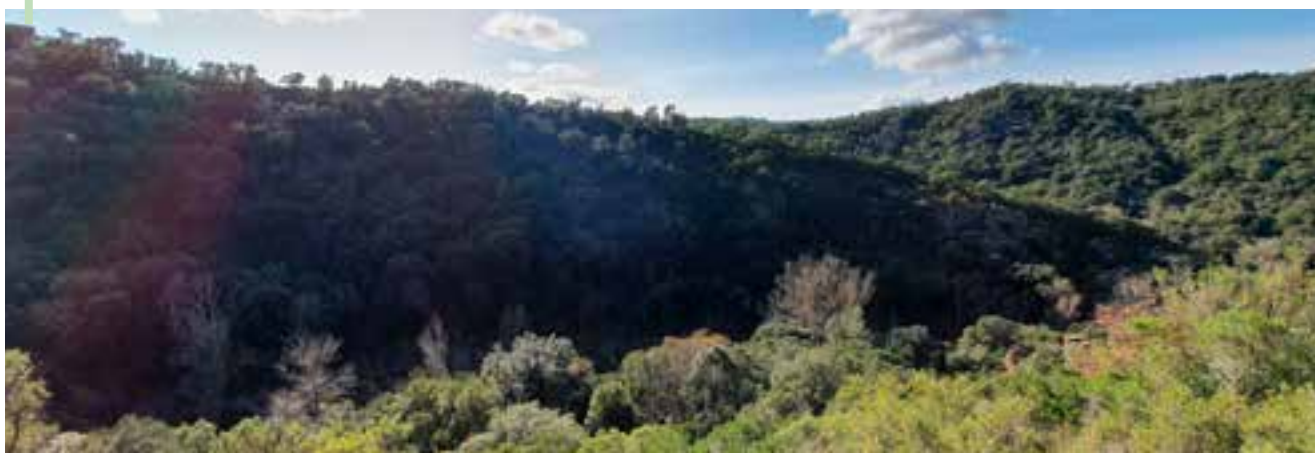
Forêt communale : vue du sentier de l'Apié de Raybaud

Les actions du syndicat mixte couvrent aujourd'hui un champ d'intervention très large, de la coordination pour la défense des forêts contre les incendies, à l'organisation des activités de loisirs, culturelles, l'animation et la communication, en passant par la maîtrise d'ouvrage, au suivi et à l'évaluation des projets pilotes.