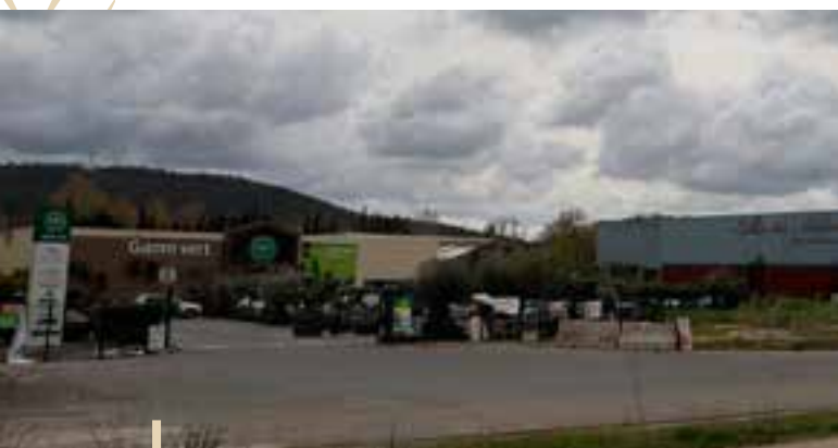
Zone d'activité économique des 4 chemins