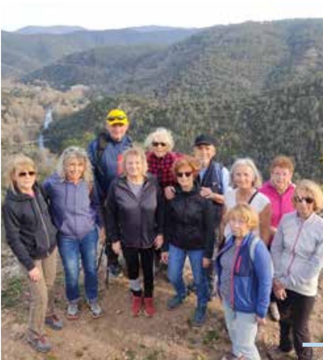
Le Pôle Seniors en randonnée sur l'Apié de Raybaud

Ces 3 années témoignent de notre engagement envers le bien-être et la vitalité de nos aînés cimentant ainsi le pôle seniors comme un véritable pilier de la vie communale.