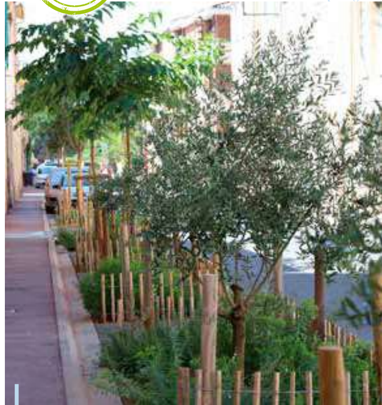
Revégétalisation en ville