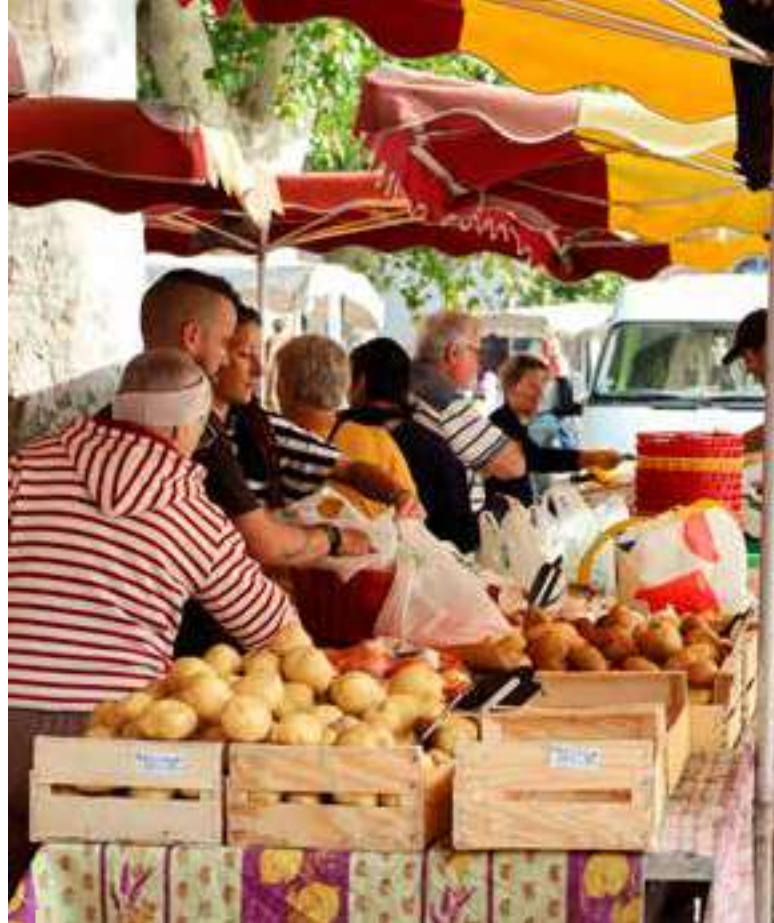
Marché du jeudi

Suite à ces travaux, le local a été entièrement rafraîchi afin d'améliorer l'accueil des clients ainsi que la qualité de vie au travail des postiers. Le bureau offre désormais un espace plus lumineux. Toutes les peintures ont été refaites et les éclairages de l'ensemble du