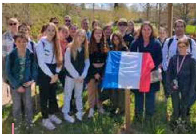
Inauguration du circuit « Les Berges du Réal » réalisé par les collégiens et Madame Le Maire

En plus de ces actions conjointes, le travail de désimperméabilisation de la cour de l'école Jean Jaurès par la commune a permis, entre-autre, au groupe scolaire Jean Jaurès d'obtenir le label E3D (Ecole en Démarche de Développement Durable). La démarche E3D valorise le travail des élèves et des équipes pédagogiques qui s'engagent et qui mettent l'éducation au développement durable au cœur du fonctionnement même de leur établissement. Les élèves peuvent ainsi agir au quotidien à l'école.