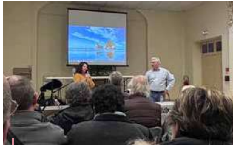
Réunion de quartier

Les administrés qui souhaitent rencontrer les élus de la commune sont priés de prendre contact avec les services de la ville. Si vous rencontrez un problème ou une difficulté, merci de contacter l'accueil de la mairie au 04 94 47 56 70, afin d'obtenir un rendez-vous avec le service et l'élue concerné. Pour une demande nécessitant de rencontrer directement le Maire, contactez le secrétariat au 04 94 47 56 76, ou posez votre question via la plateforme GRC ( grc.lesarcssurargens.fr ).