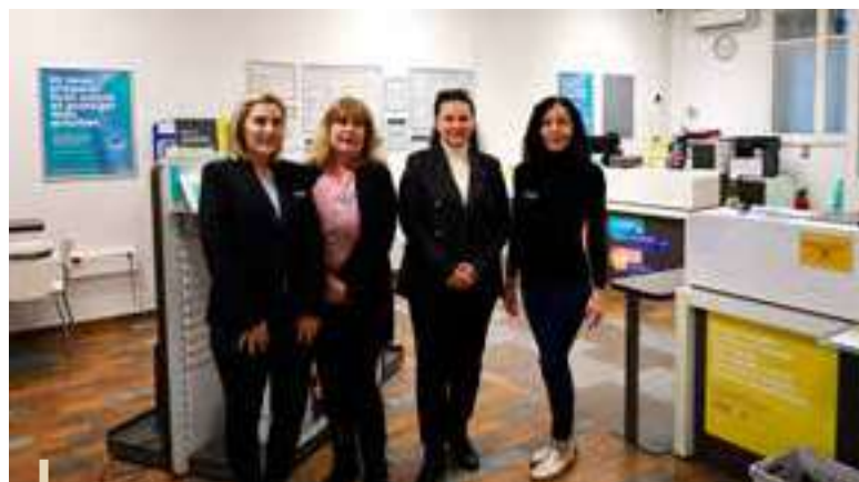
Travaux de rénovation du bureau de poste

Ces précisions et réaffirmations ont pour objectifs de faire du marché un élément de dynamisation de la ville et de répondre aux attentes des consommateurs.