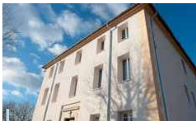
Rénovation globale du château Morard : isolation par l'extérieur, changement des menuiseries et installation de climatisation