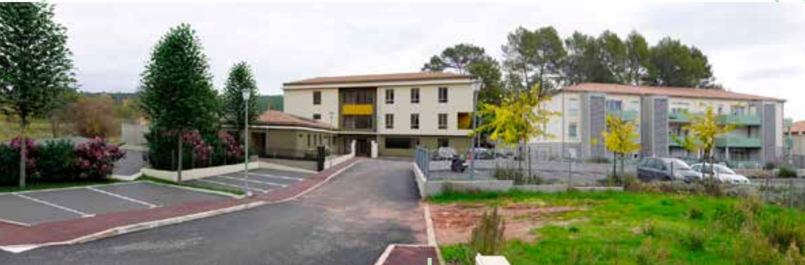
Insertion paysagère de la maison d'enfants