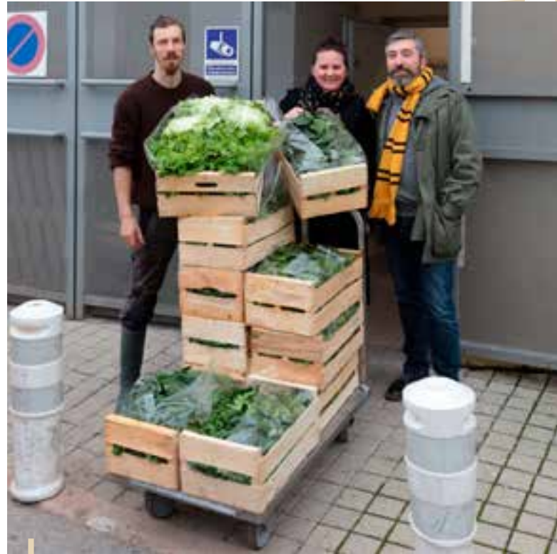
Récolte de légumes de la ferme Saint-Jean

Cet apport dans notre cuisine centrale remet en question le fonctionnement habituel. En effet, les cuisiniers doivent être en capacité d'adapter les menus en fonction des produits livrés.