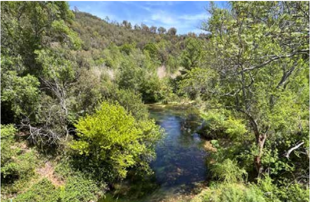
L'Argens dans la forêt communale

Dans la lutte contre le ruissellement, la commune - parallèlement aux plantations d'arbres réalisés - a désimperméabilisé 200 m 2 en centre-ville, et ainsi déconnecté environ mille mètres carrés d'eau de ruissellement. C'est autant d'eaux déconnectées du réseau pluvial qui peuvent profiter à la végétation et s'infiltrer dans nos nappes phréatiques. A cela s'ajoute la cour de récréation de l'école élémentaire Jean Jaurès qui a connu à l'été 2020 des travaux de désimperméabilisation.