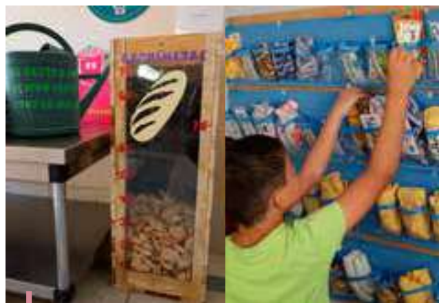
Un arrosoir pour récupérer l'eau non bue, un gachimètre et des serviettes en tissus pour par chacun

Le permis du gymnase du collège a été accordé en 2023. La commune, conformément au PLU, a demandé et obtenu par le Conseil Départemental, des travaux de