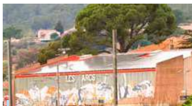
Installation de panneaux photovoltaïques : auto-consommation collective (avec des bâtiments publics)

La salle polyvalente a été équipée en 2023 de panneaux photovoltaïques. La production est réalisée en autoconsommation collective et permet d'alimenter en journée une partie des bâtiments communaux, en comptant la salle polyvalente : Château Morard, Dojo, école Hélène Vidal ou encore la crèche multi-accueil le Greou. Une étude est en cours pour le déploiement de nouveaux panneaux photovoltaïques en autoconsommation collective sur les toitures de nos bâtiments. À ce jour, 75 Kilowatt-crêtes ont été installés.