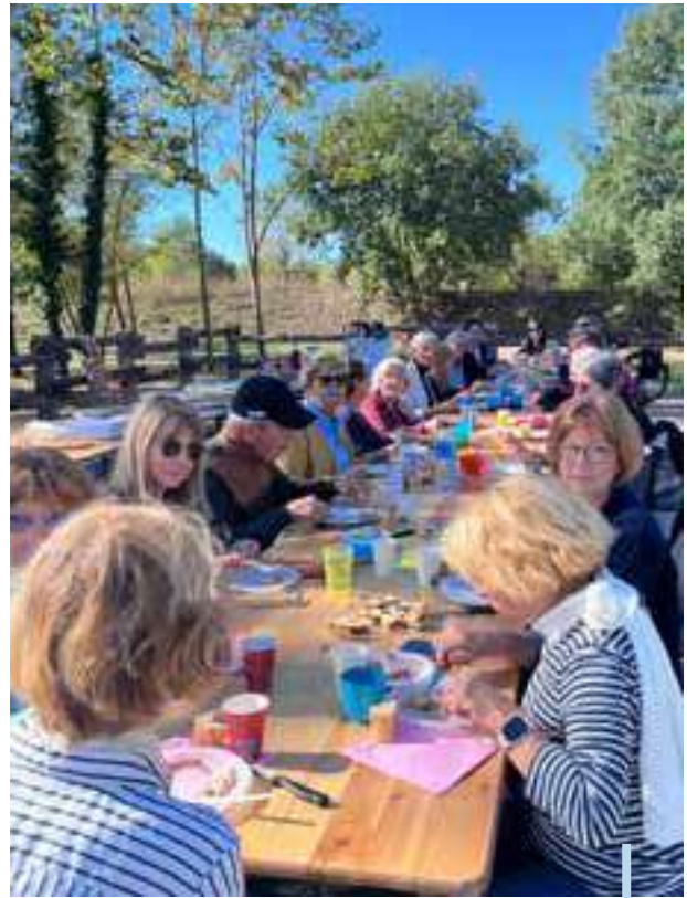
Le Pôle Seniors pique-nique au P'Arcs de Loisirs.

Le pôle seniors ne se contente pas d'être un lieu d'échange, de partage où de rencontre mais une plateforme vibrante où chacun peut s'épanouir.