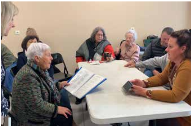
Chants provençaux avec l'école de l'Óulivié