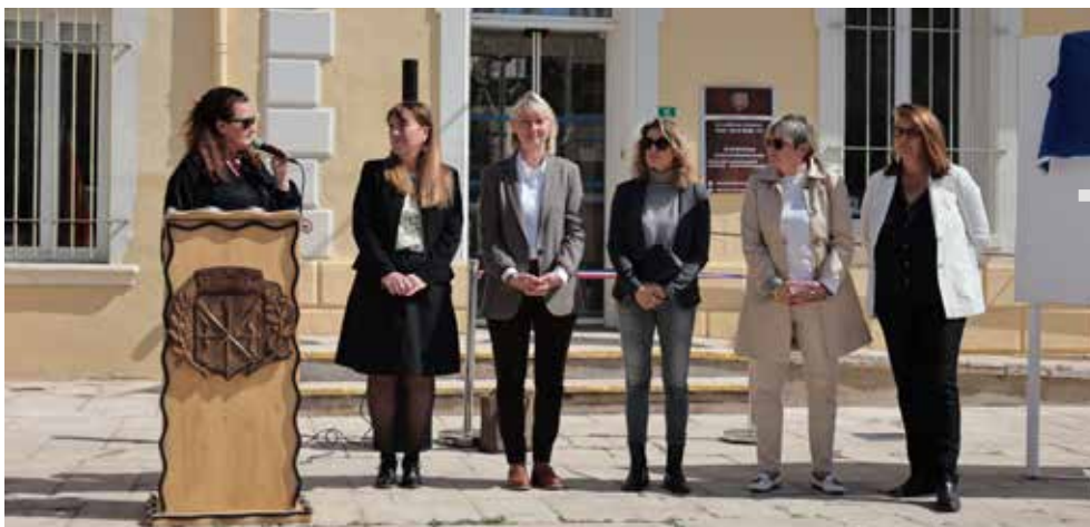
Inauguration de 5 chantiers majeurs en faveur de la transition écologique

C'est le 1 er projet d'auto-consommation collective en Dracénie, fruit de l'engagement des élus en matière de transition écologique. Ce système consiste à déduire de nos consommations énergétiques la production réalisée par nos panneaux photovoltaïques. Au jour de l'inauguration, celle-ci représentait 20% de la consommation de l'ensemble des bâtiments communaux.