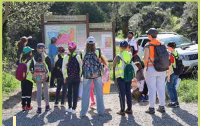
À l'étude du partage de la forêt