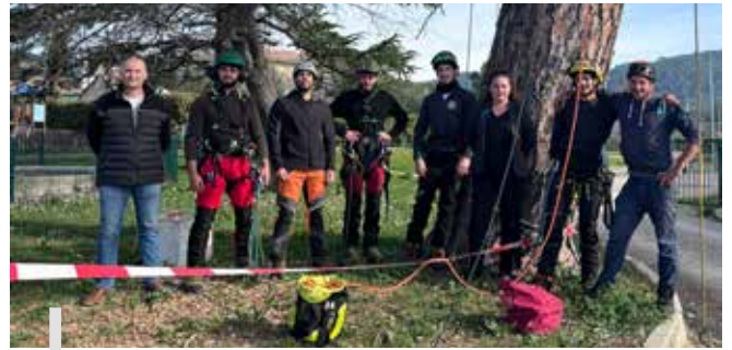
Madame le Maire est allée saluer les étudiants de l'école qui lui ont fait une démonstration de leur matériel devant le château Morard.

Afin de leur assurer une formation dans les meilleures conditions possibles, la commune leur a mis un local à disposition ainsi que des sujets à élaguer, ce qui est nécessaire pour assurer aux jeunes élagueurs, l'apprentissage du métier en conditions réelles