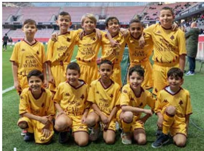
Les enfants de l'ASA Foot à l'Allianz Riviera de Nice

Le 18 novembre 2023 le stade de foot Allianz Riviera à Nice accueillait le match France-Gibraltar dans le cadre des éliminatoires de l'UEFA Euro 2024. À cette occasion, des enfants du club de l'ASA foot ont accompagné les joueurs sur le terrain. Ils sont entrés sur la pelouse tenant la main des joueurs, et ont chanté à leur côté la Marseillaise, au milieu d'un stade rempli de supporters. Une occasion unique pour les enfants de rencontrer leurs idoles et de toucher du doigt leur rêve de devenir un jour, des joueurs professionnels.