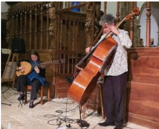
Duo à Sainte-Roseline