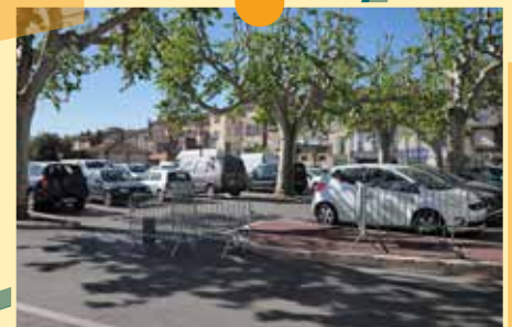
Des places de stationnement libérées sur la Place du Général De Gaulle