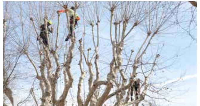
Les jeunes élagueurs, rafraîchissant les platanes du centre-ville.