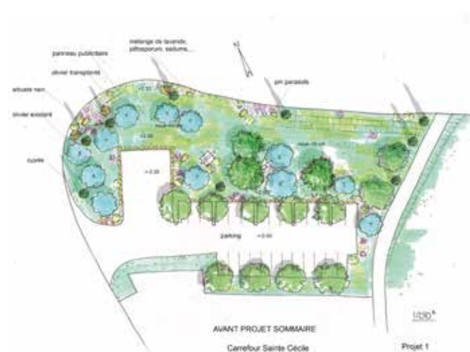
Insertion Paysagère