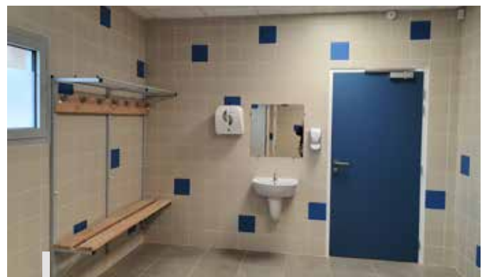
Intérieur des vestiaires