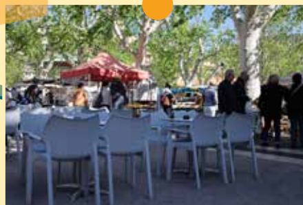
Une meilleure intégration des terrasses des commerçants au sein du marché