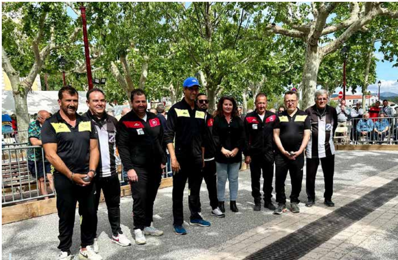
Championnat de pétanque du Var au Arcs : les finalistes

Avec ce rayonnement départemental et le soutien indéfectible de la commune aux événements sportifs qui se déroulent sur le territoire, nous honorons notre label « Terre de jeux 2024 ».