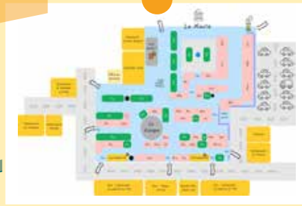
Un nouveau plan permettant une meilleure circulation