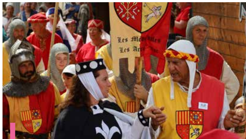
Ouverture des Médiévales 2022