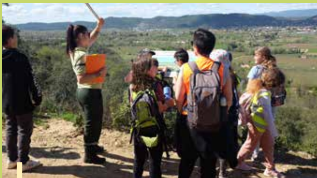
En forêt, avec l'agent ONF