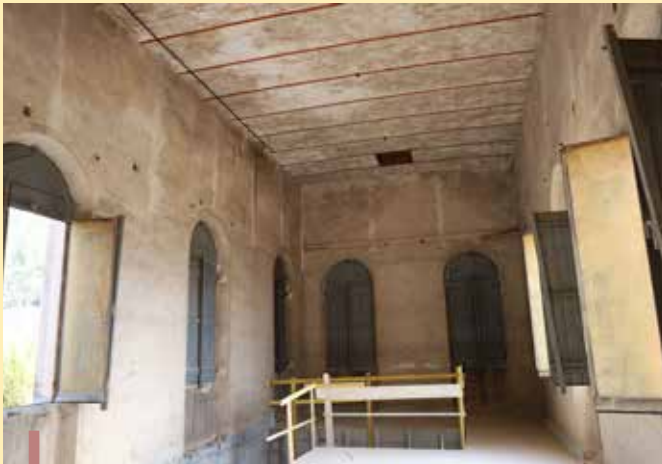
Rénovation de l'intérieur