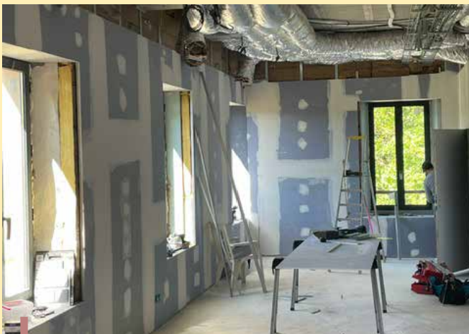
Rénovation de l'intérieur