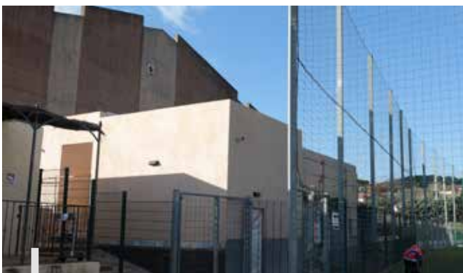
Les nouveaux vestiaires de la salle polyvalente

Cet investissement pour la réfection des vestiaires avec mise aux normes et extension de la partie dédiée au foot, est cofinancé par l'État à hauteur de 107 351,20 € au titre de la DETR et par la Région Sud à hauteur de 220 000€ au titre du FRAT. La Fédération Française de Foot participe à hauteur de 10 000€. La commune investit quant à elle près d'1 million d'euros.