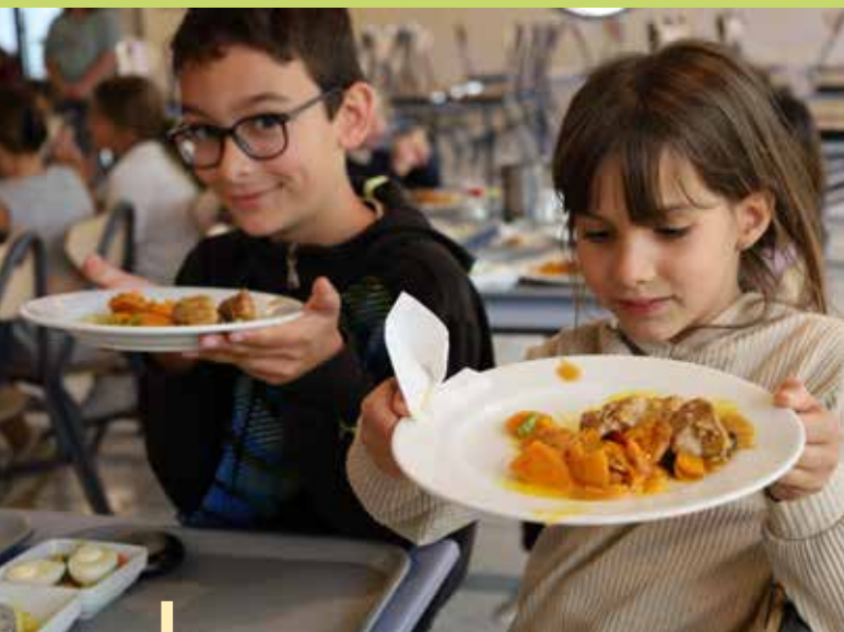
Nos légumes : de la ferme à l'assiette

Les retours sont positifs, les menus variés, avec des produits extra-frais et de saison, récoltés au jour le jour.