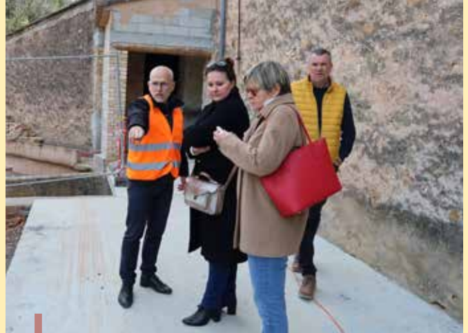
Madame le Maire, accompagnée de Mme Charles et de M. Lamat, visite le chantier

La volonté de la ville est de faire vivre le site au quotidien.