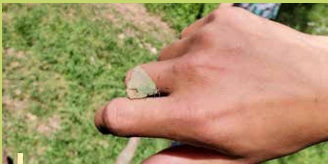
Observation : ici la Thécla de l'arbousier