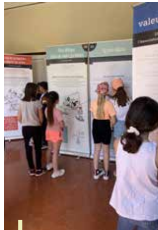
Classe de CM1 de l'école Jean Jaurès