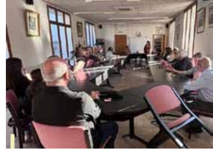
Conférence de l'association « Comité 1905 » de Draguignan