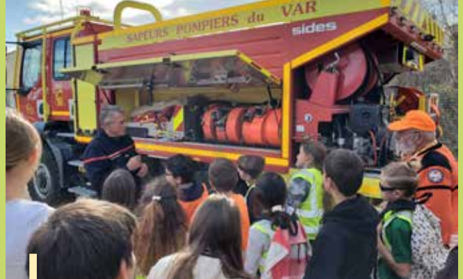
Rencontre avec les pompiers des Arcs