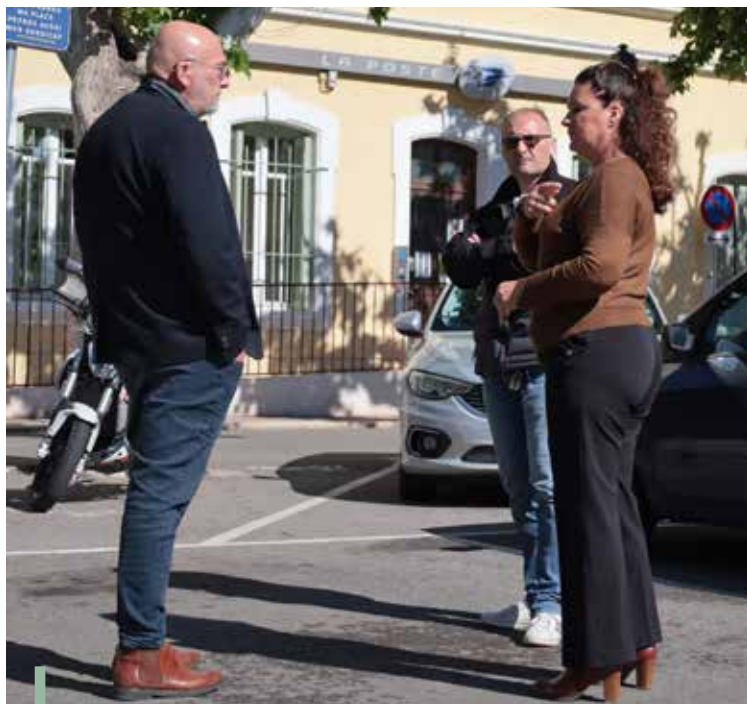
Rendez-vous sur l'emplacement du distributeur

Ce nouveau distributeur de billets, situé en face de La Poste, répondra à une attente forte des habitants et des commerçants.