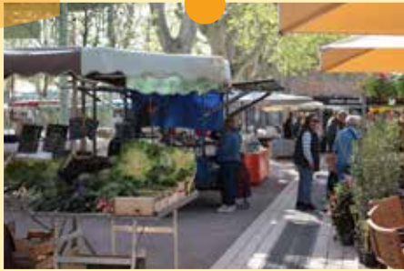
Une ambiance musicale