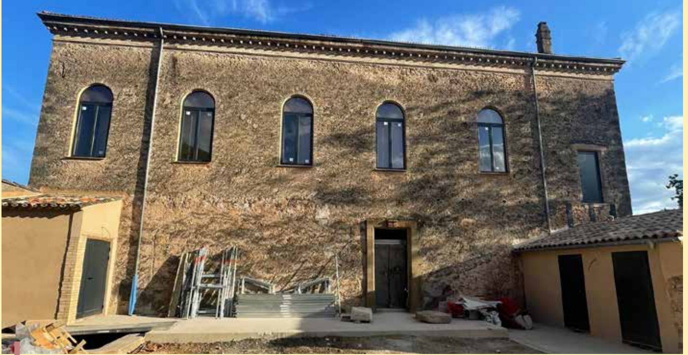
Le moulin : cour intérieure