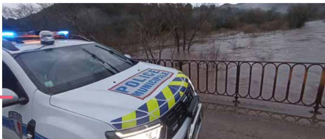
Surveillance des cours d'eau entre les 9 et 10 mars

La ville participera à un exercice piloté par l'Etat en juin pour tester les relations et la réactivité entre les différentes institutions.