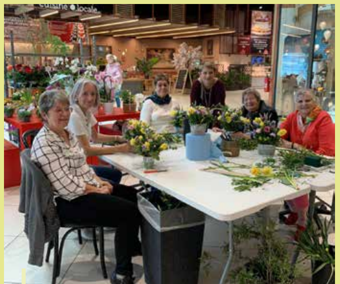
Atelier fleurs en partenariat avec le fleuriste Hyper U Les Arcs "Passion Flore" - Avril 2024

Un rappel important : pour devenir adhérent, il vous suffit d'avoir 50 ans ou plus et de vous inscrire gratuitement auprès du service du Pôle Séniors.