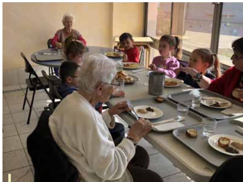
Les aînés du Cepoun déjeunent en compagnie des enfants de l'école maternelle Jean Jaurès !