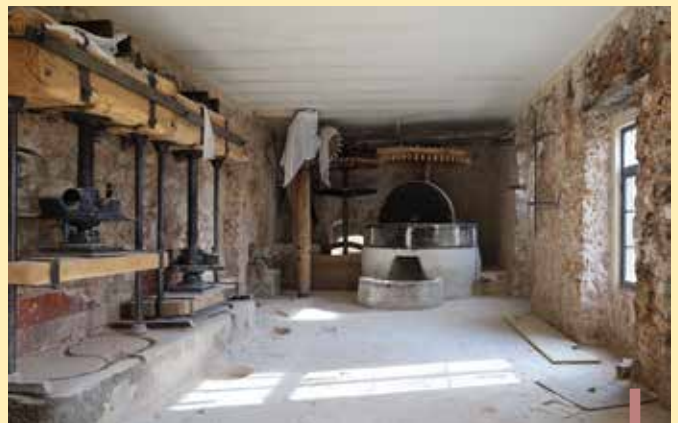
Les travaux pendant la rénovation.