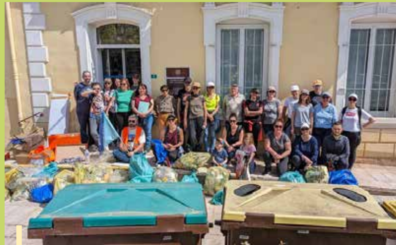
Opération « Nettoyons le Sud »

En tout, ce sont 52,8 kg de déchets d'emballage, 12,4 kg de verre et 10,9 kg de déchets "poubelle" (tuyaux, jantes de voiture...), soit un total de près de 76 kg de déchets qui ont été ramassés en un peu plus d'une heure. 2 bouteilles de 500 ml plus 1 bouteille de 1,5 l ont également été remplies de mégots. Ces derniers seront confiés aux élèves du lycée Agricampus des