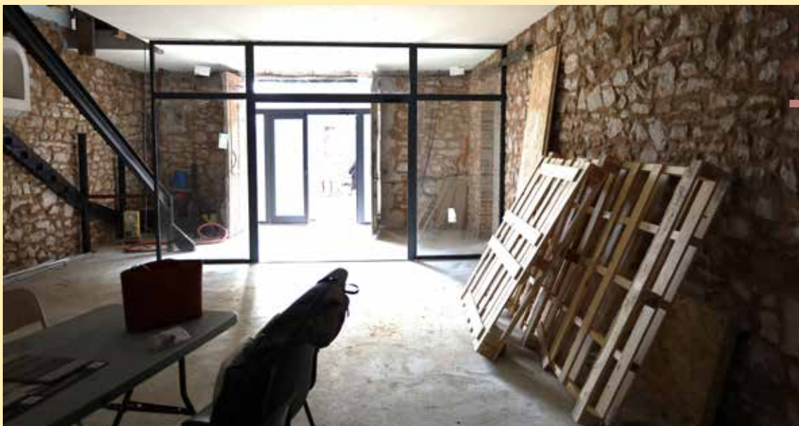
Rénovation intérieure en cours