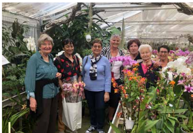
Visite de la "Serre d'orchidées Vacherot" à Roquebrune

Du 2 avril au 18 juin 2024, chaque mardi après-midi se déroule une séance d'une heure et demi de gym douce pour nos anciens, animée par un professionnel.