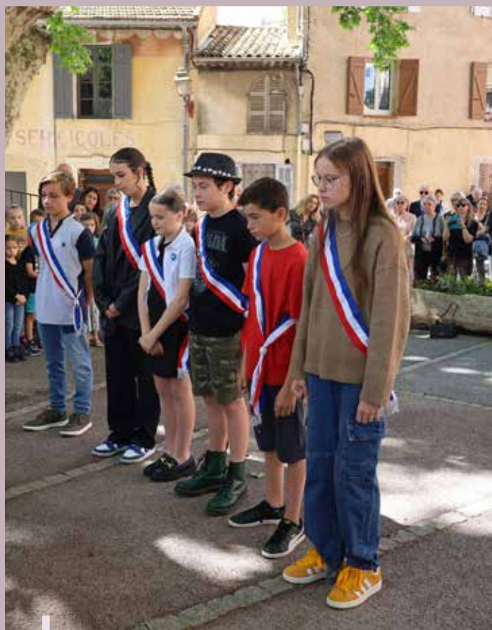
Les Conseillers Municipaux Jeunes (CMJ) devant le monument aux morts

Cette commémoration a marqué l'ouverture de différents événements proposés à l'occasion du 80 e anniversaire du Débarquement de Provence.