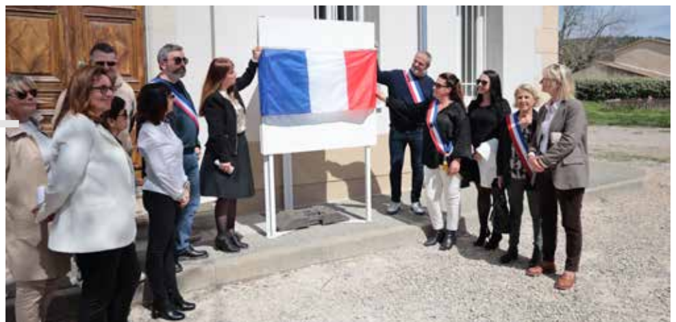
Inauguration des travaux du Château Morard