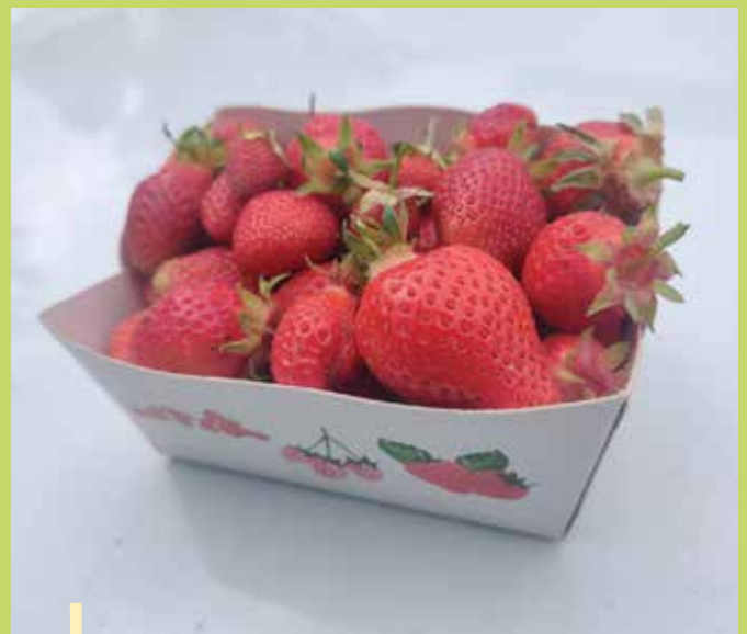
Fraises (variété circine) de la ferme