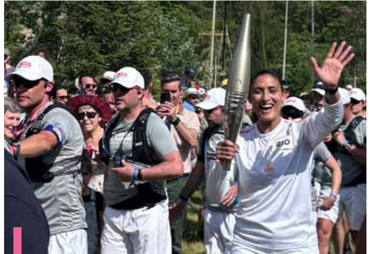
Relais de la flamme olympique aux Salles-Sur-Verdon

Les épreuves des Jeux Olympiques seront diffusées en direct sur un écran géant (lorsque le temps le permettra).