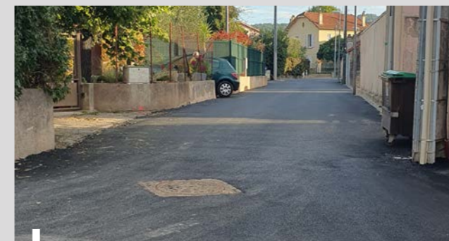
Chemin du Baguicé

Nos agents ont travaillé en régie pour entretenir les chemins de la commune afin de garantir la sécurité de tous : Chemin des eaux des vives, Ancien Chemin de Flayosc, Chemin de Fabrègues, Chemin de Saint Jean, Chemin de la Cognasse pour un montant de 100 000€.