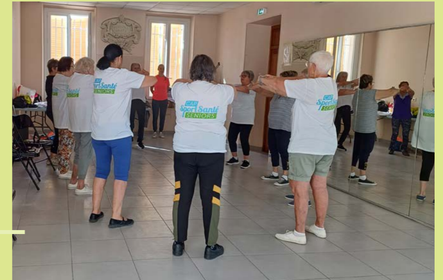
Activité avec le CDOS

Le programme « CAP Sport Santé Séniors » lancé par le Comité Départemental Olympique et Sportif du Var (CDOS) avec GV Trans a débuté pour le plus grand plaisir des participants. Proposé aux séniors qui ne fréquentent pas de club sportif ou n'ont pas l'habitude de faire du sport, ce programme permet aux séniors de « bouger », car garder une activité physique est primordiale... à tout âge.