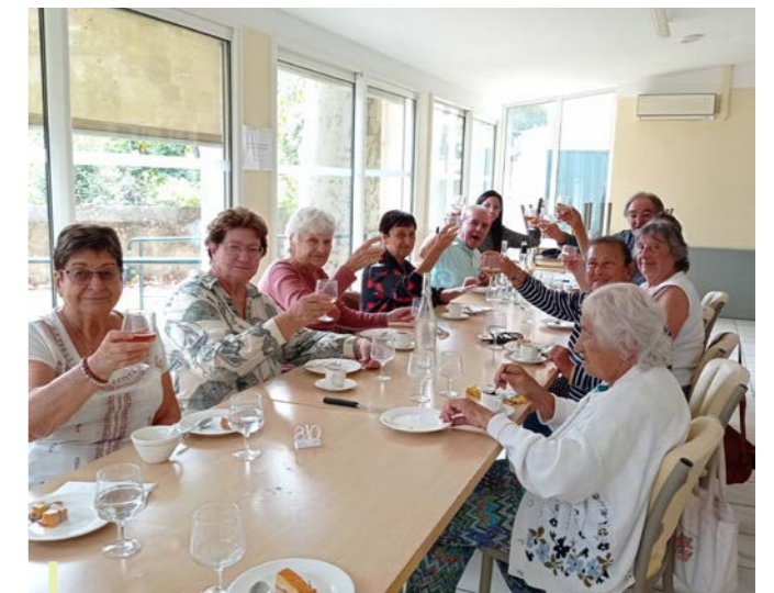
De bons moments pour nos aînés