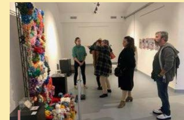
Visite de l'expo par le maire et ses adjoints

Cette exposition sur le thème "Océan" a été réalisée en partenariat avec Récifs"O" Crochet. Elle proposait des panneaux pédagogiques, des fossiles et des activités sur l'apparition et l'évolution de la vie dans les océans, ainsi qu'un récif très original réalisé au crochet ! Une manière ludique et pédagogique de mettre l'accent sur la préservation des océans.