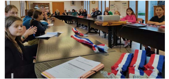
Nos jeunes en Conseil Municipal

Pour cette nouvelle mandature, les jeunes auront la possibilité de s'impliquer davantage dans le fonctionnement des projets, en étant au cœur de l'action. De la même manière que les Conseillers municipaux, ils pourront porter des projets et les mener à bien, accompagnés des services et des élus de la ville. Leur participation pourra se faire à la hauteur du temps dont ils disposeront.