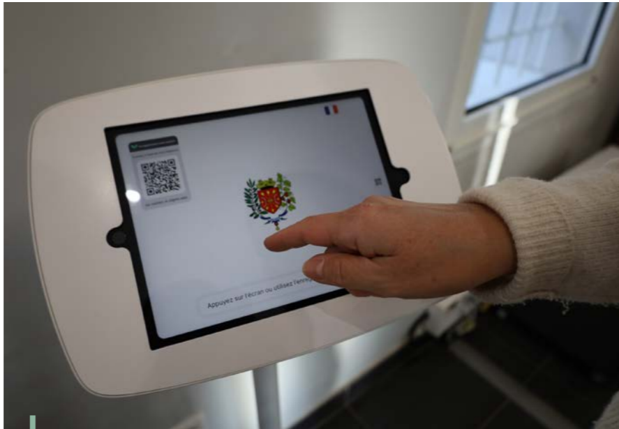
Tablette de gestion des visiteurs

Soyez assurés que les données enregistrées ne servent qu'à des