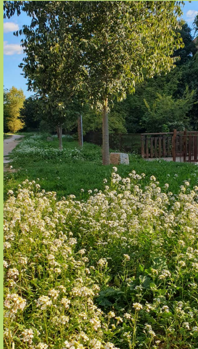
Balade en Réal