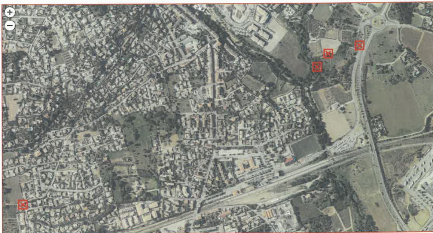
Planche photographique du 31 mars 2026 du Procès-verbal d'affichage

✘ Affichage sur des panneaux situés en bordure de voie publique, visibles et lisibles par tous aux emplacements indiqués sur le plan de situation ci-dessous.