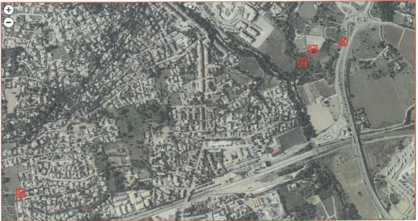
Planche photographique du 31 mars 2026 du Procès-verbal d'affichage

✘ Affichage sur des panneaux situés en bordure de voie publique, visibles et lisibles par tous aux emplacements indiqués sur le plan de situation ci-dessous.